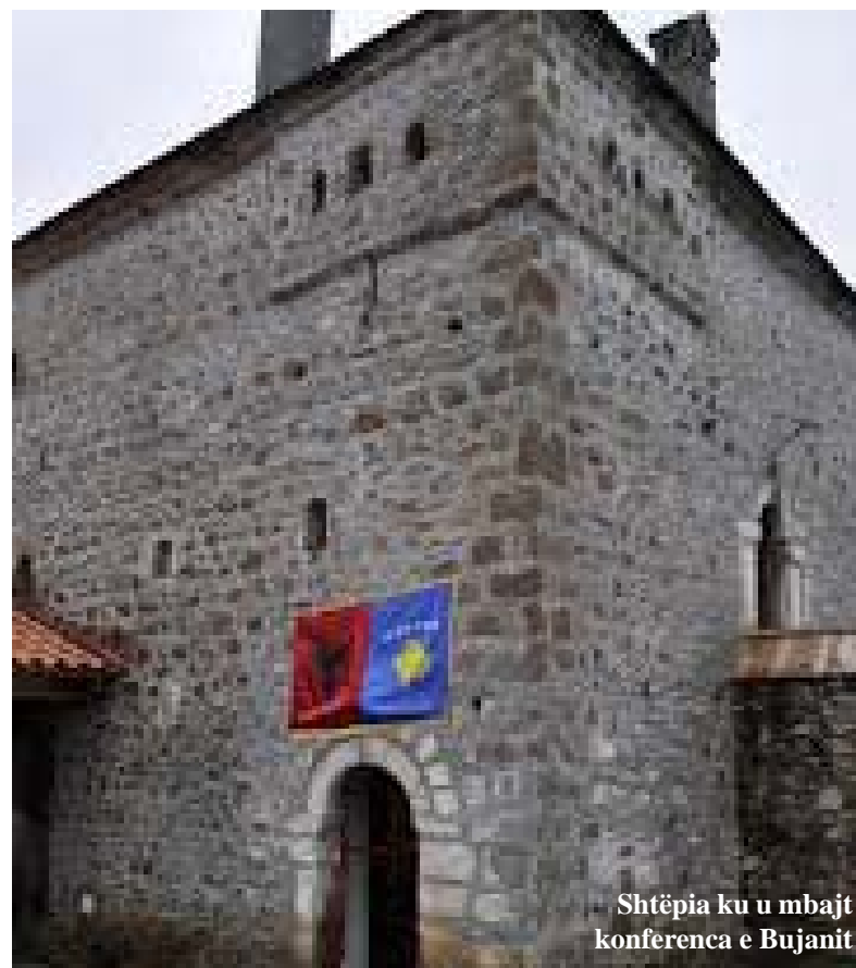
Shtëpia ku u mbajt konferenca e Bujanit